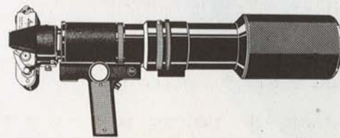
Dispositif de mise au point rapide TELEVIT®, pour objectifs de 280, 400 et 560 mm de focale.

Demandez tous renseignements complémentaires à l'un des fournisseurs spécialisés LEICA de votre quartier ou de votre ville. Demandez lui également une démonstration du procédé LEICA, ce qu'il fera bien volontiers.